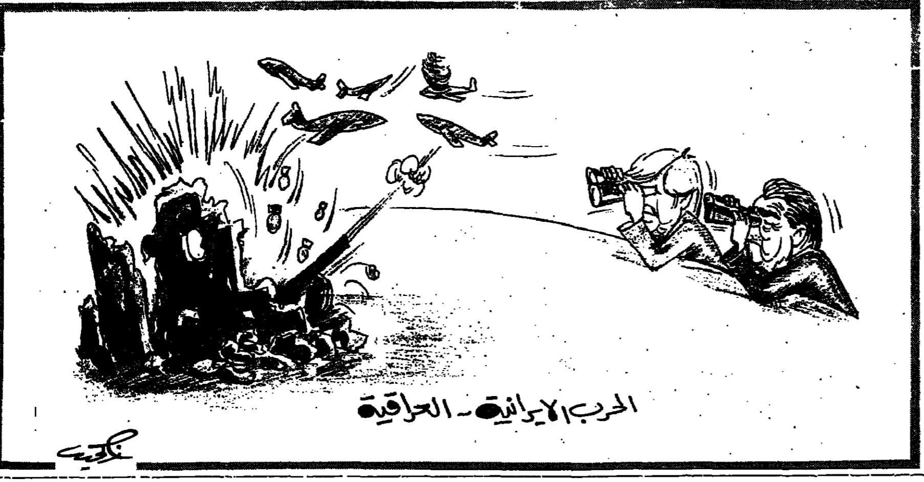
الحرب الإيرانية - العراقية